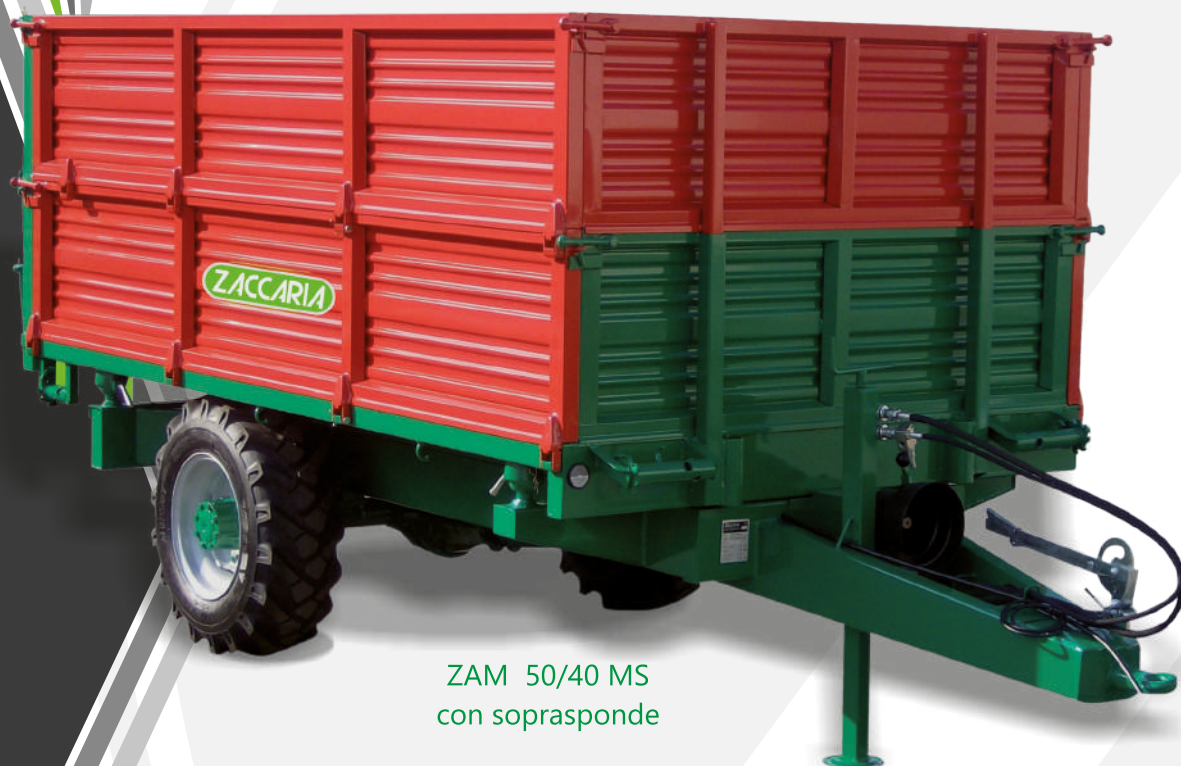
ZAM 50/40 MS con soprassonde