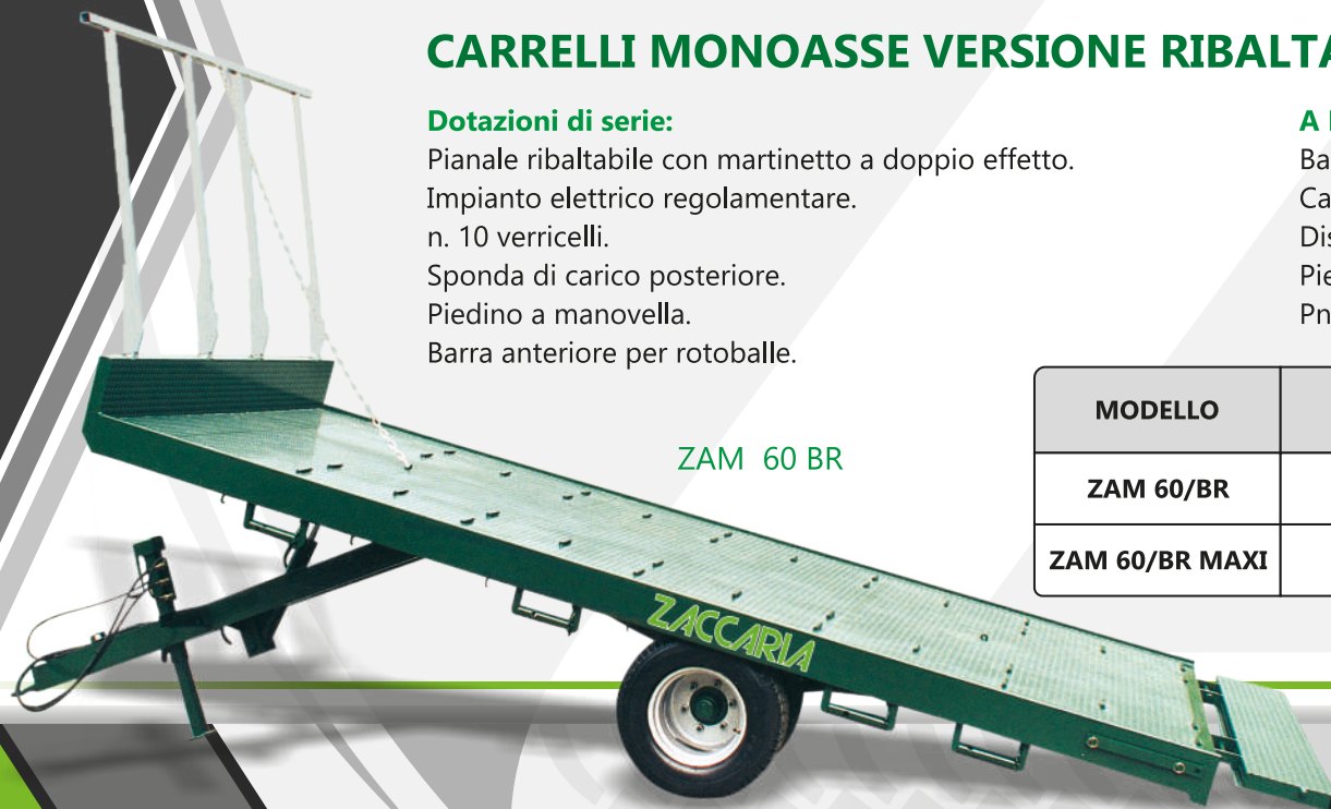
ZAM 60 BR

Barra Posteriore per Rotoballe. Cassetta Attrezzi. Dispositivo omologato comando freno per trattrice senza valvola freno rimorchio. Piedino Idraulico. Pneumatici Nuovi 215/75 R17.5