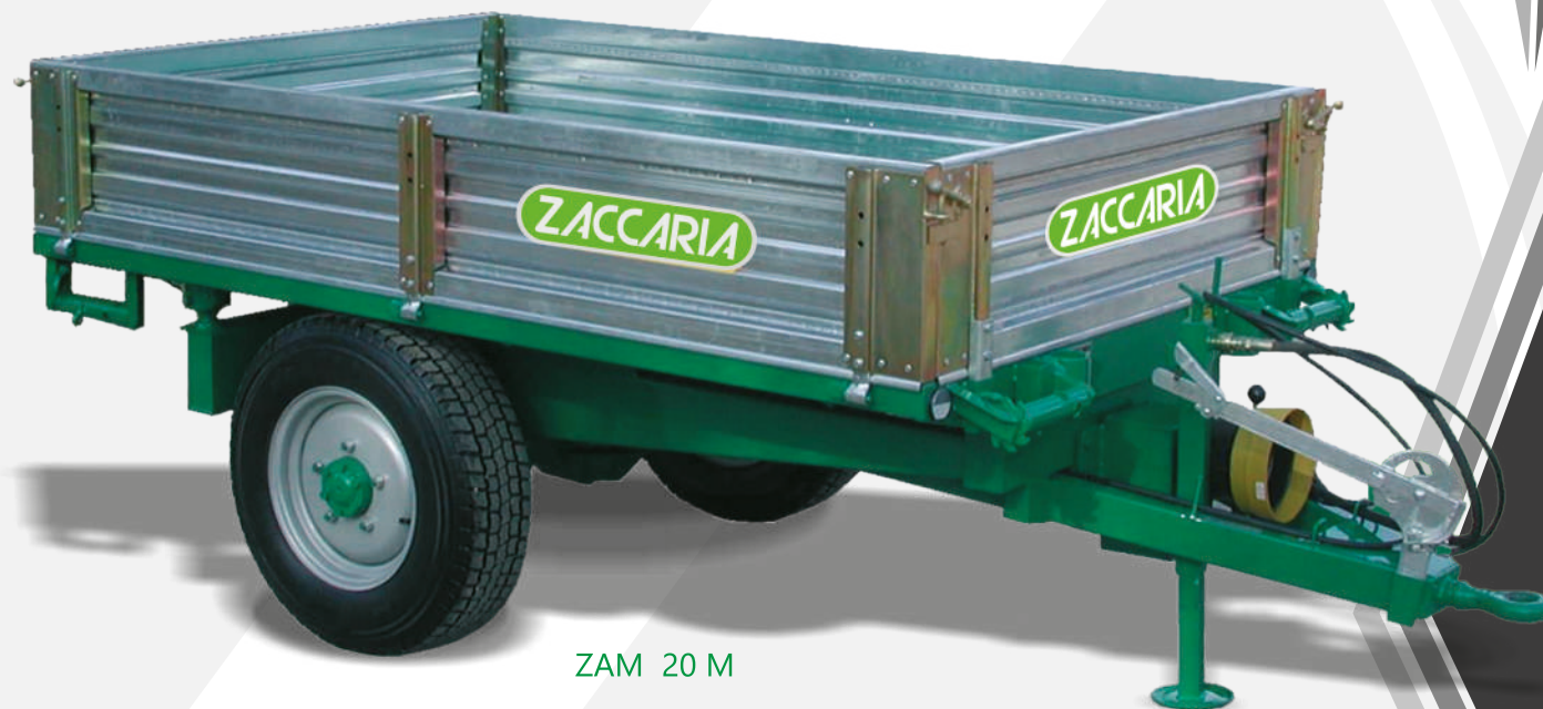
ZAM 20 M