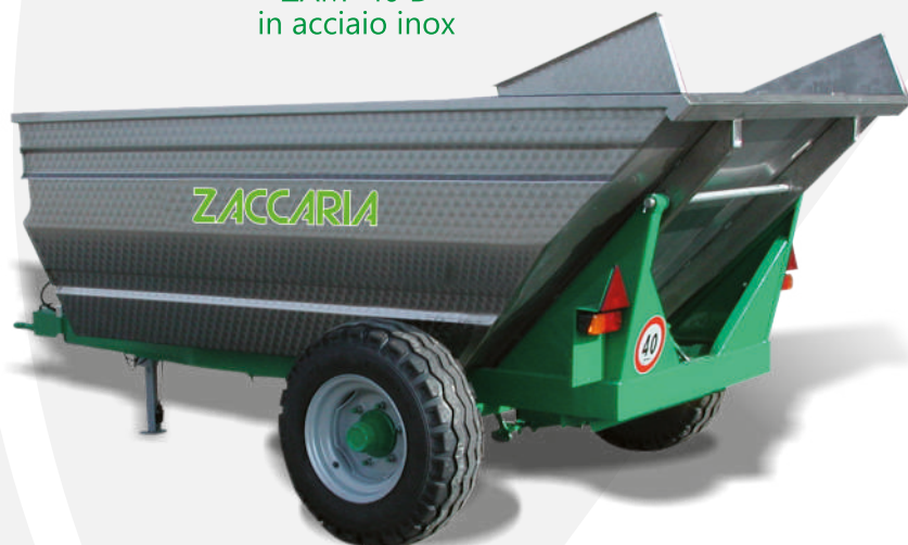
ZAM 40 D in acciaio inox

Dispositivo omologato comando freno per trattore senza valvola freno rimorchio su ZAM 50 D SUPER. Freno Idraulico su mod. ZAM 25/D – ZAM 40/D. Soprasponde H. cm 40 (anteriore e laterali). Soprasponda posteriore H. cm 40. Verniciatura interna per alimenti. Zincatura cassone su tutti i modelli. Zincatura soprasponde. Vasca in acciaio inox.