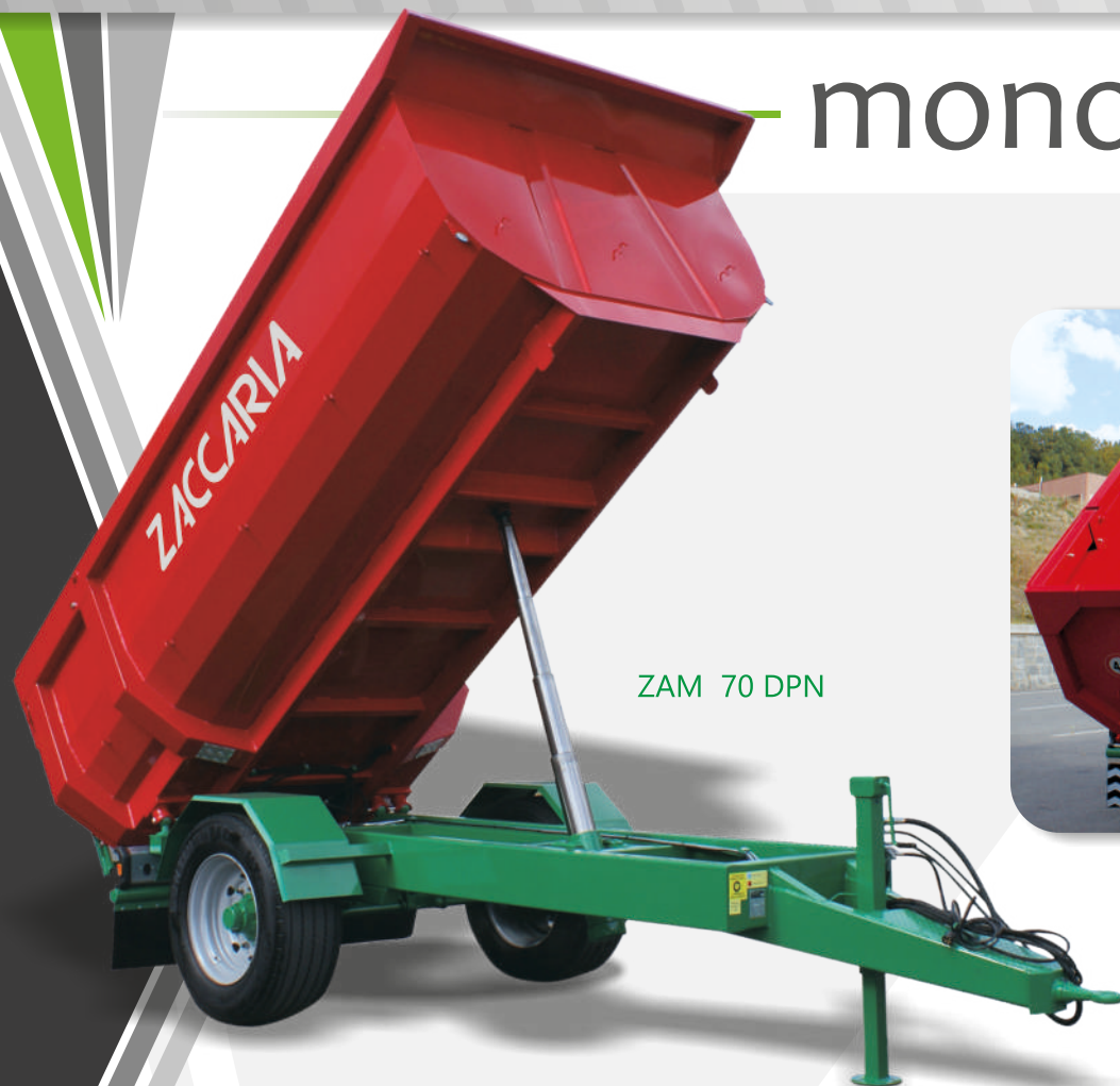
ZAM 70 DPN