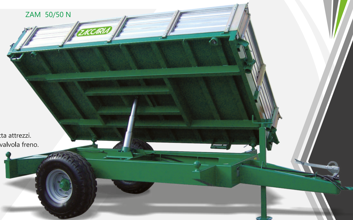
ZAM 50/50 N

Apertura Sotto/Sopra delle Sponde Laterali. Barra anteriore per legna. Bocchettone per cereali. Cassetta attrezzi. Dispositivo omologato comando freno per trattore senza valvola freno. Freno idraulico supplementare (uso aziendale). Pali per tronchi h. 1,5 mt. Piedino Idraulico. Pompa ingranaggi e Cardano. Rampe meccaniche in ferro (portata Q.li 40). Soprasponde in Rete H. 80 cm. Soprasponde. Sponde e Soprasponde in Alluminio. Sponde in Comas. Tubi per Pali laterali o Posteriori interno cassone.