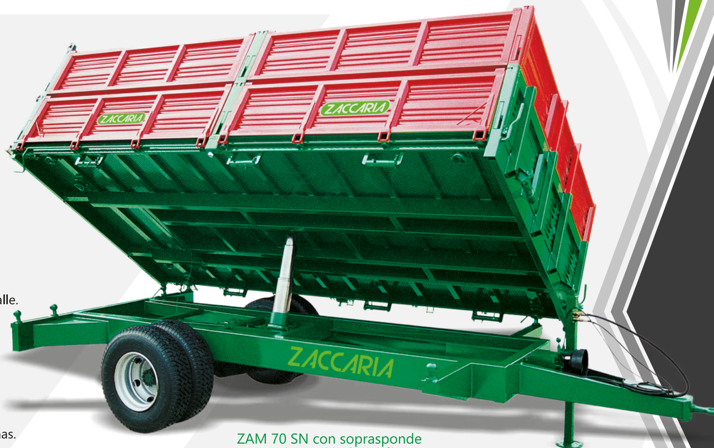
ZAM 70 SN con soprassonde e piantoni industriali