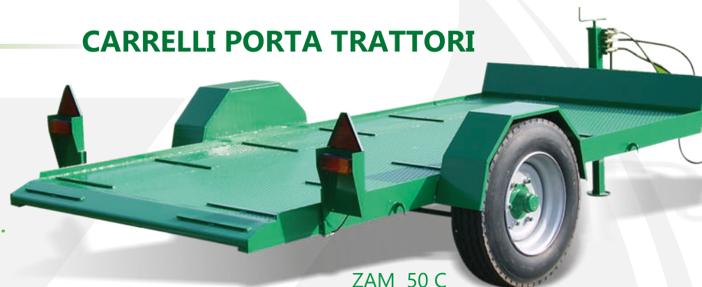
ZAM 50 C

Non serve la sponda posteriore per il carico macchine.