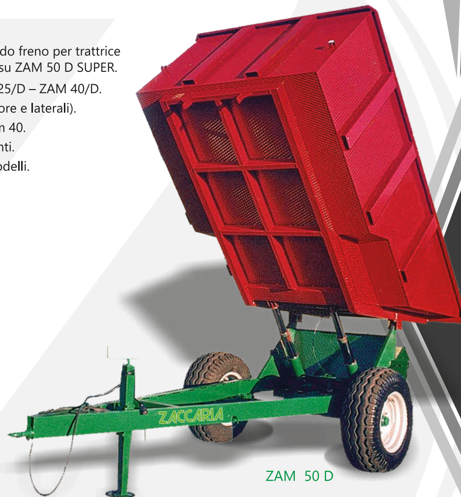
ZAM 50 D